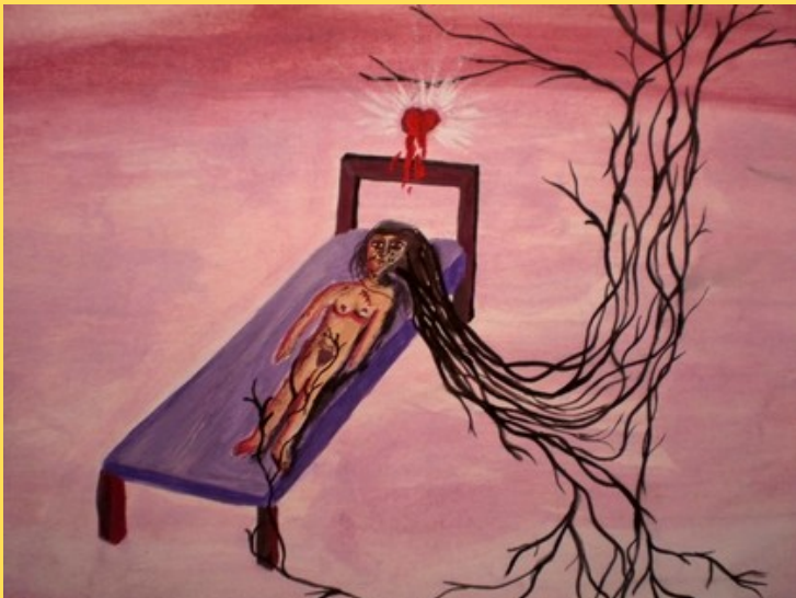
Pintura por Luz